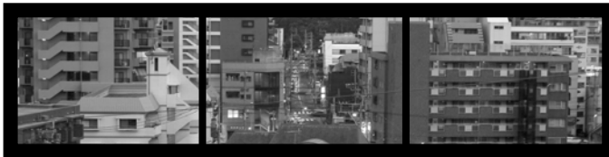
図 2) 横 3 面分の 1 枚映像の分割素材