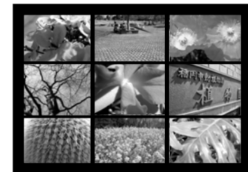
図 5) 9 面マルチ映像の素材例