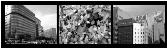
図 1) 横 3 面マルチ映像の素材

本研究での結論は 19 吋、120 吋の映像による実験をとおしたデータが基本になっている。劇場映画と異なりマルチ映像は上映会場毎の様子が標準化できないため、本研究の数値が必ずしも共有できるとは限らない。今後はさらに大画面化と動画での実験へと進め、より汎用性の高いデータを得たい。