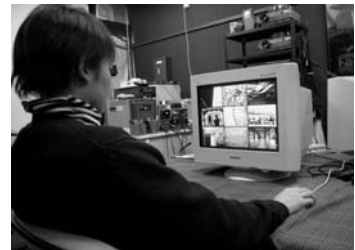
図 3) 19 吋モニター実験