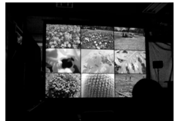
図 4) 120 吋スクリーン実験